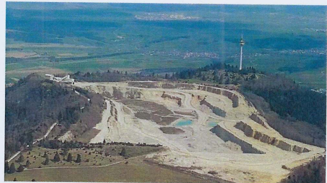
Bild: Mondlandschaft Steinbruch Plettenberg